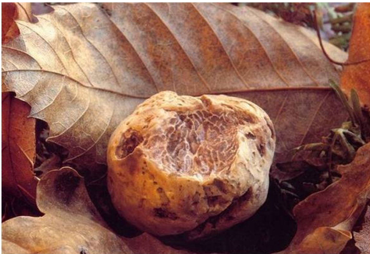
Brevetto per raddoppiare vita tartufi