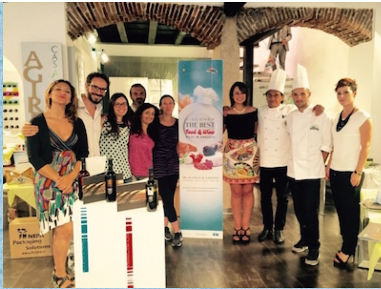
del Polo Agire a Casa Abruzzo

MILANO – Cinquemila visitatori in due settimane per “Discover The Best Food&Wine Made in Abruzzo”, la rassegna di oltre cinquanta eventi (tra seminari, tavole rotonde, 15 show cooking, aperitivi, esposizioni, degustazioni e mini corsi alla scoperta delle eccellenze abruzzesi) che il Polo Agire ha organizzato a Milano in occasione di Expo2015. Dal 24 luglio al 7 agosto, a Casa Abruzzo, in via Fiori Chiari 9, nel centrale quartiere di Brera, Agire ha presentato al pubblico le proprie eccellenze e i progetti realizzati finora.